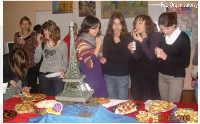
Degustacja francuskich potraw

W przerwie spotkania na wszystkich czekała, tradycyjnie już, „francuska przekąska”. Pikanterii całemu spotkaniu dodało przedstawienie