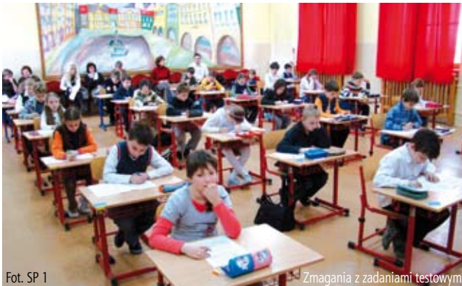
Fot. SP 1

Przyjaźń, koleżeństwo, wsparcie w trudnych sytuacjach, wzajemne zrozumienie stanowiły myśl przewodnią tegorocznego konkursu zatytułowanego „JA, TY, MY”.