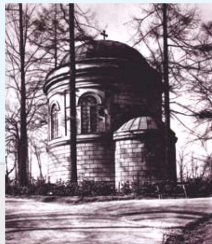
Rotunda po klasycystycznej przebudowie

Zapraszamy Czytelników do współredagowania tej strony. Prosimy o nadsyłanie ciekawostek związanych z Cieszynem (np. anegdot, przepisów kulinarnych, zdjęć, dokumentów, wzorów rękodzieła artystycznego itp.), które mogłyby zainteresować innych i wzbogacić wiedzę o naszym mieście. Gwarantujemy zwrot wszystkich otrzymanych materiałów.