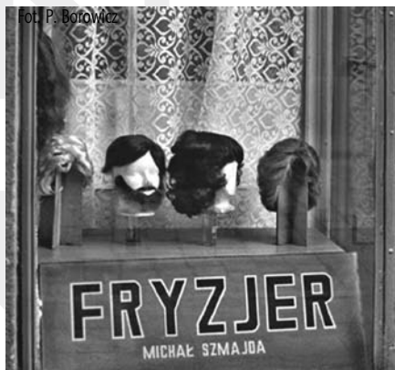
Jedno ze zdjęć prezentowanych na wystawie

Od 3 kwietnia w Śląskim Zamku Sztuki i Przedsiębiorczości zobaczyć będzie można wystawę Piotra Borowicza pt. „Fotografie (nie) pamięci”. Prezentowane na niej zdjęcia zostały zrobione w Cieszynie i Krakowie w latach 1989-2007.