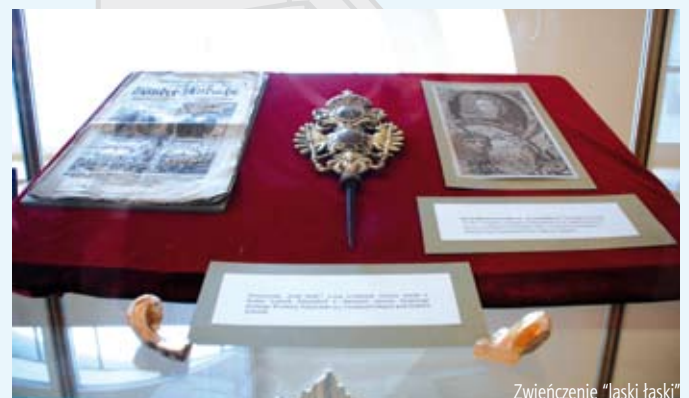
Zwienczenie "laski łaski"