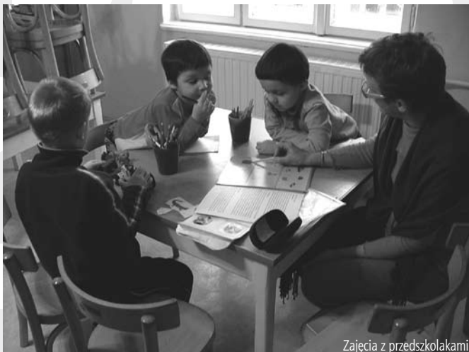
Zajęcia z przedszkolakami