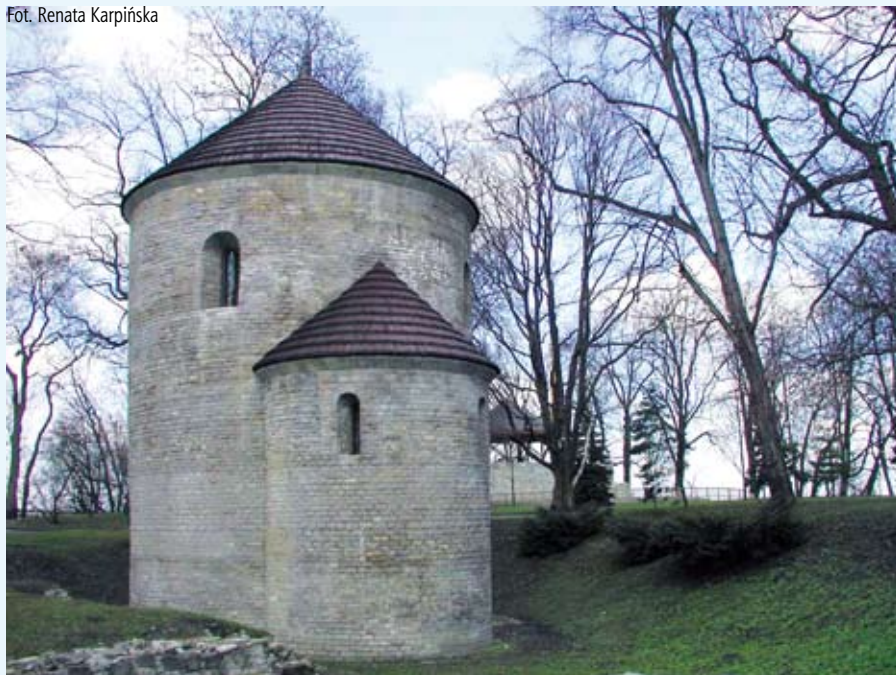
Rotunda pod wezwaniem św. Mikołaja

Rotundę zbudowano z kamienia łamanego z okładziną z ciosów wapiennych. Nawa ma wymiary 6,4 do 6,6 metrów (wewnątrz) oraz 9,3 metra (zewnątrz).