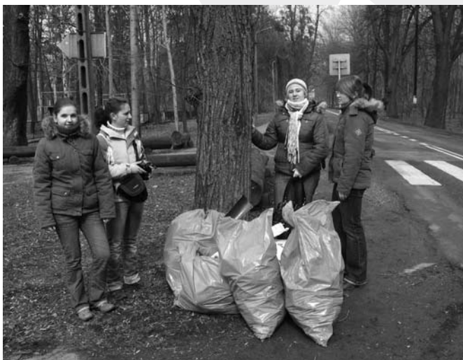
Młodzież biorąca udział w akcji

27 marca Komisja Ochrony Przyrody Oddziału PTTK „Beskid Śląski” w Cieszynie, przy udziale Nadleśnictwa Ustroń, była organizatorem II edycji imprezy „Wiosenne Sprzątanie Rezerwatów Przyrody”, które odbyło się na terenie Cieszyna.