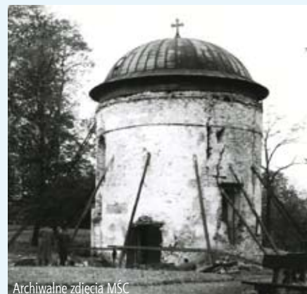
Archiwalne zdjęcia MŚC

Można ją otrzymać w Cieszyńskim Centrum Informacji (Ratusz, parter).